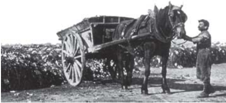
Les débuts de la collecte d.es ordures ménagères, en 1884.